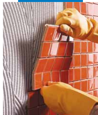
Posa a rivestimento di mosaico ceramico