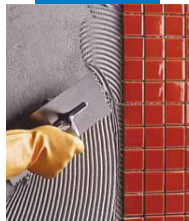
Posa a rivestimento di mosaico ceramico