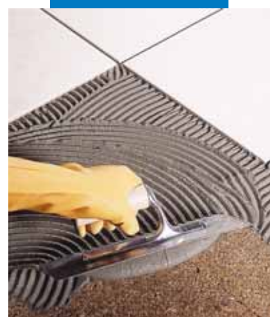
Posa a rivestimento di piastrelle in monocottura su sughero

N.B. I dati tecnici di Kerabond impastato con Isolastic sono riportati sulla scheda tecnica di quest'ultimo.